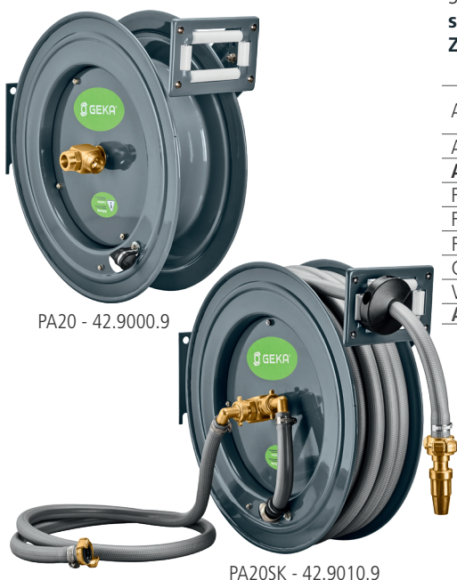
PA20 - 42.9000.9