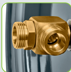
GEKA® plus Winkeldreharmatur mit vollem 3/4" Wasserdurchfluss