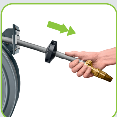
Arretierung durch Zug am Ende des Schlauchs steuerbar